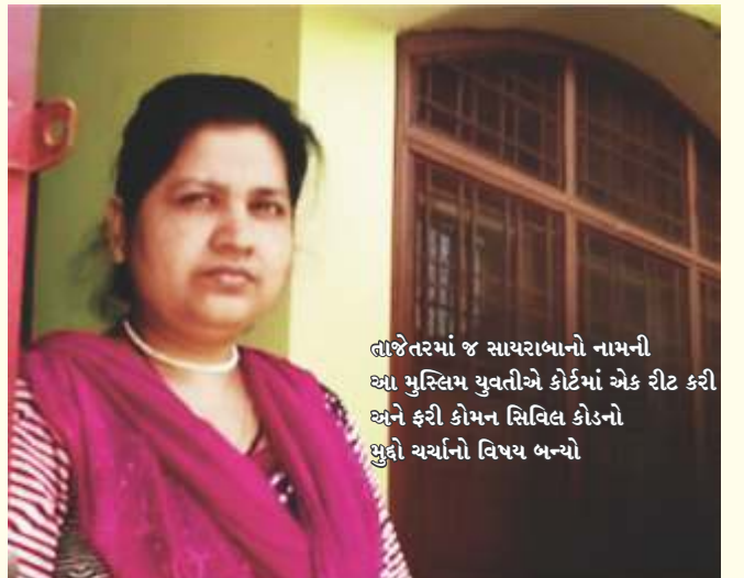
તાજેતરમાં જ સાયરાબાનો નામની આ મુસ્લિમ યુવતીએ કોર્ટમાં એક રીટ કરી અને ફરી કૉમન સિવિલ કોડનો મુદ્દો ચર્ચાનો વિષય બન્યો

તાજેતરમાં સાયરાબાનો નામની મુસ્લિમ મહિલાને તેના પતિ દ્વારા તલાક આપવામાં આવ્યા. તે બાદ સાયરાબાનોએ કોર્ટમાં રીટ કરી. સાયરાબાનોએ પોતાના તલાક સંબંધિત ચુકાદાને ગેરકાયદે જાહેર કરવાની માંગ કરી છે, તેની અરજીમાં તેણે લખ્યું છે કે તેનું દહેજ નિમિત્તે ઉત્પીડન કરવામાં આવ્યું છે, તેની સાથે તેનાં