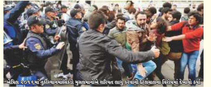
એપ્રિલ ૨૦૧૬માં તુર્કિસ્તાનમાં સેંકડો મુસ્લિમોએ શરિયત લાગુ કરવાની હિલચાલના વિરોધમાં દેખાવો કર્યા

● ગત એપ્રિલ મહિનામાં તુર્કી સરકારે ફરીથી ઈસ્લામિક કાનૂન-શરિયત અપનાવવાની તરફેણ કરી તો સમગ્ર દેશભરમાં વિરોધ પ્રદર્શનો ચાલુ થઈ ગયાં. સંસદની બહાર સેંકડો મુસ્લિમોએ શરિયત લાગુ કરવાના વિરોધમાં દેખાવો કર્યા. પ્રદર્શન કરનારાઓએ ‘તુર્કી હંમેશાં સેક્યુલર રહેશે’ એવા સૂત્રોચ્ચાર પણ કર્યા. વિરોધ કરનારને વિખેરવા માટે પોલીસે ટિયરગેસના સેલનો મારો કર્યો અને રબર બુલેટ પણ ચલાવી. આ સમાચાર તા. ૨૮/૪/૨૦૧૬ના દિવ્ય ભાસ્કરની ‘વર્લ્ડ વિન્ડો’ કોલમમાં ફોટા સાથે વિગતવાર છપાયા છે.