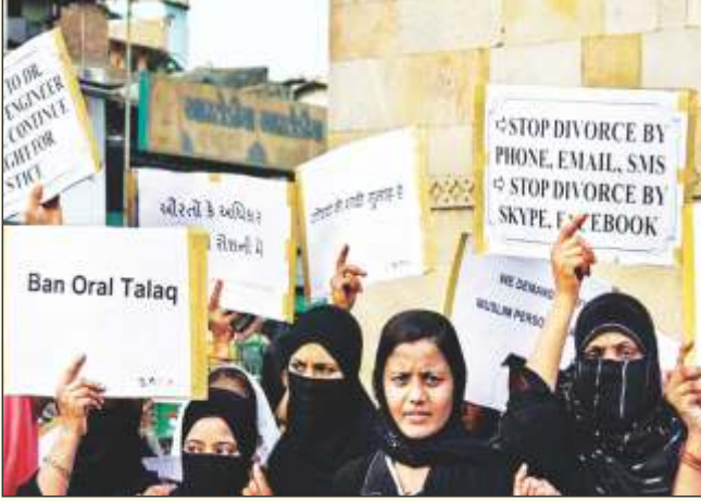
આસ્ટોડીયા (અમદાવાદ)ની મુસ્લિમ મહિલાઓ દ્વારા મુસ્લિમ કાયદાઓના વિરોધમાં દેખાવો

સાસરિયાં દ્વારા કૂરતા આચરણ છે. તેના પતિ - સાસુ અને સસરાએ તેને કંફી દવાઓ આપી તેની યાદશક્તિને નુકસાન કર્યું છે, તેની આ બીમારીને આધાર બનાવીને તેને તલાક આપવામાં આવી છે.